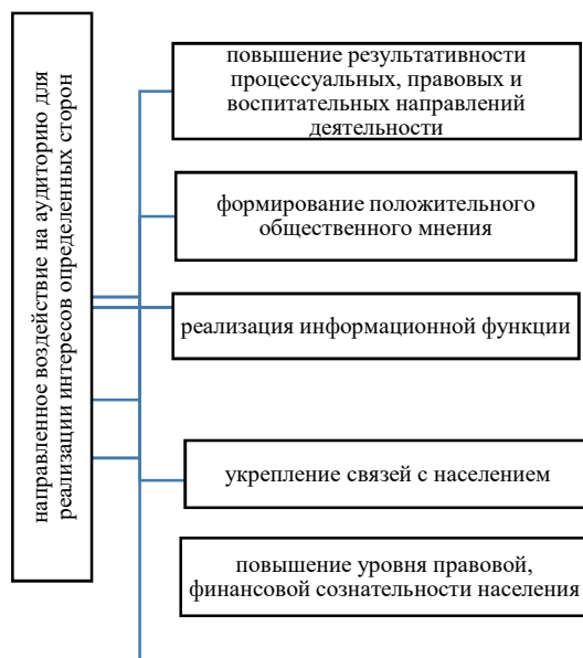
Рис. 3. Цель и задачи взаимодействия СМИ и государственных и общественных институтов

Таким образом, средства массовой информации играют важнейшую роль в общественной жизни в настоящее время, обеспечивая информационную взаимосвязь между общественными и государственными институтами.